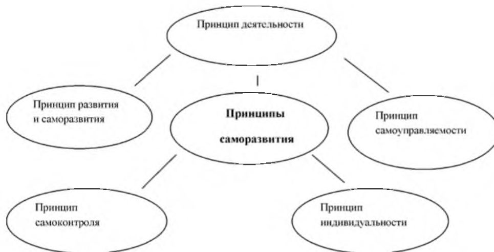
Рис. 2. Основные принципы самообразования.

ципов самообразования позволяет построить эффективную систему методов и определенную технологию приемов реализации в вузах профессионально-педагогического самообразования педагога. К некоторым из принципов можно отнести: принцип развития и саморазвития, принцип деятельности, принцип самоуправления и другие (рис. 2).